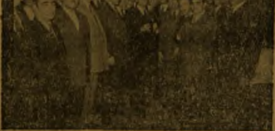
Ortada Cumhurbaşkanımız Celal Bayar, Belediye ve İl Genel Meclis üyeleri arasında