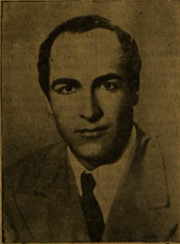
Sanatkârın bir pozu

tek monoton müziği dinlemek icap ediyor. Bu tek, monoton müzgli dinliyeciler ve bizler bu arada aynı şeyleri yüzbininci defa